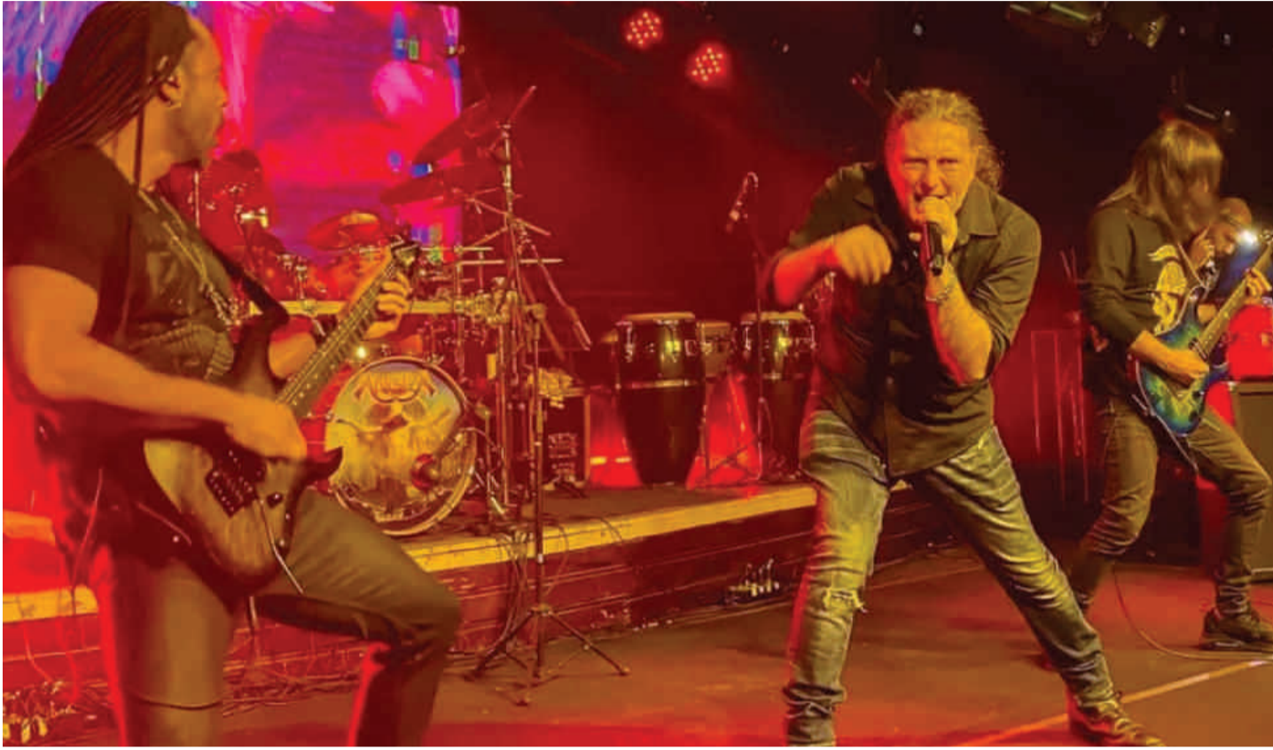
Banda Angra anuncia turnê em comemoração aos 20 anos e pausa no grupo a partir de 2025

Os ingressos estão disponíveis no site bilheteriaexpress.com.br e o Centro Cultural