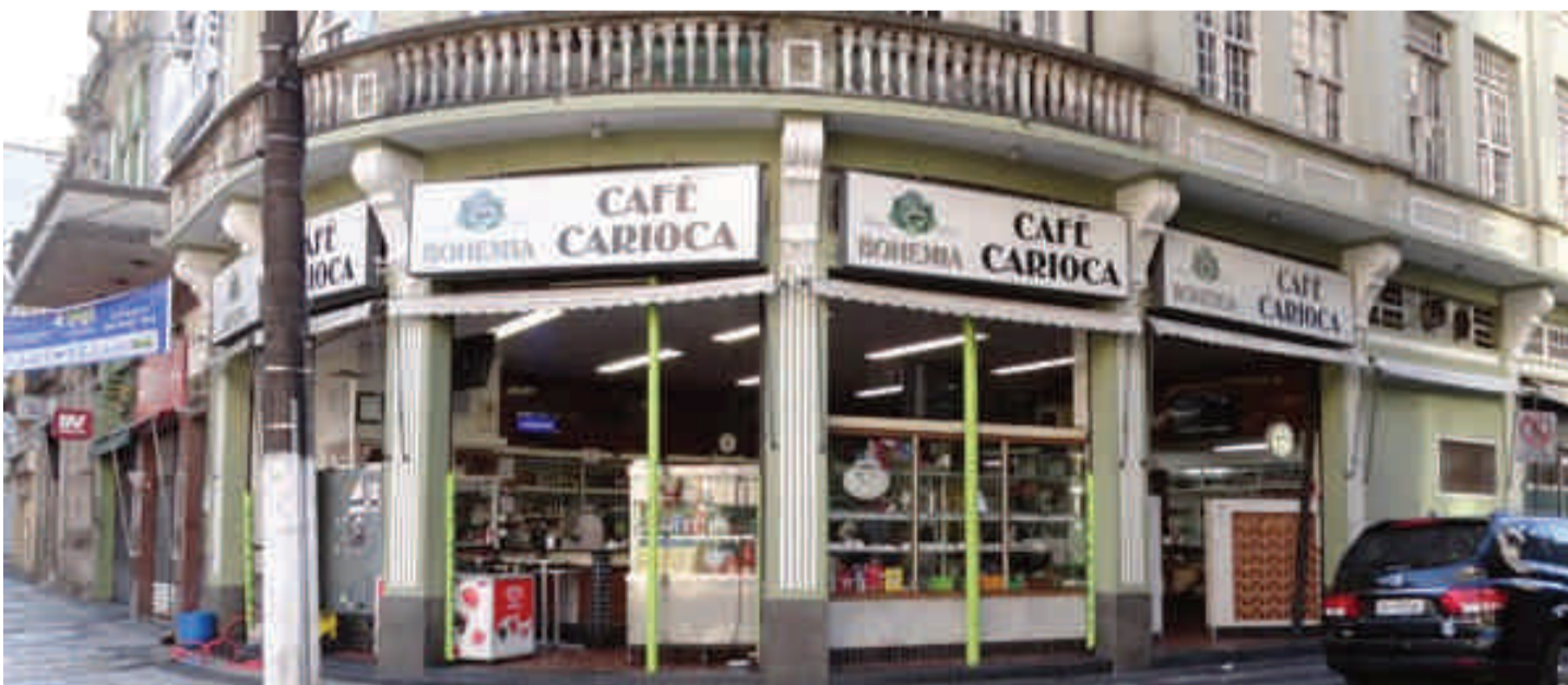
Café Carioca celebra tradição de seus 85 anos com atrações culturais, no Centro de Santos, neste domingo

Português fica na Rua Amador Bueno, 188 - Centro Histórico, Santos