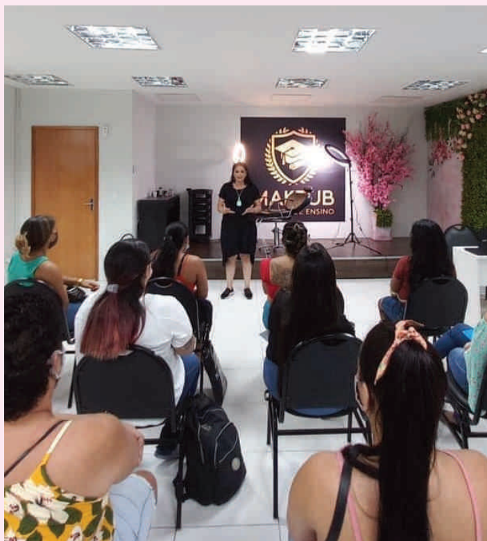
Instituto de Ensino Maktub

Para garantir sua vaga, os interessados devem inscrever-se pelo telefone (13) 991055144, pois