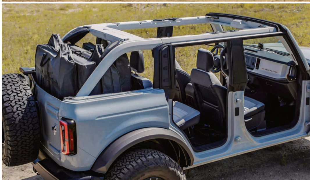
O Ford Bronco Wildtrak possui teto e portas removíveis

solina, com 334 cv e 57,3 kgfm. Ele leva o carro de 0 a 100 km/h em 5,8 s e a velocidade máxima só não supera os 200 km/h por segurança. E, mesmo as-