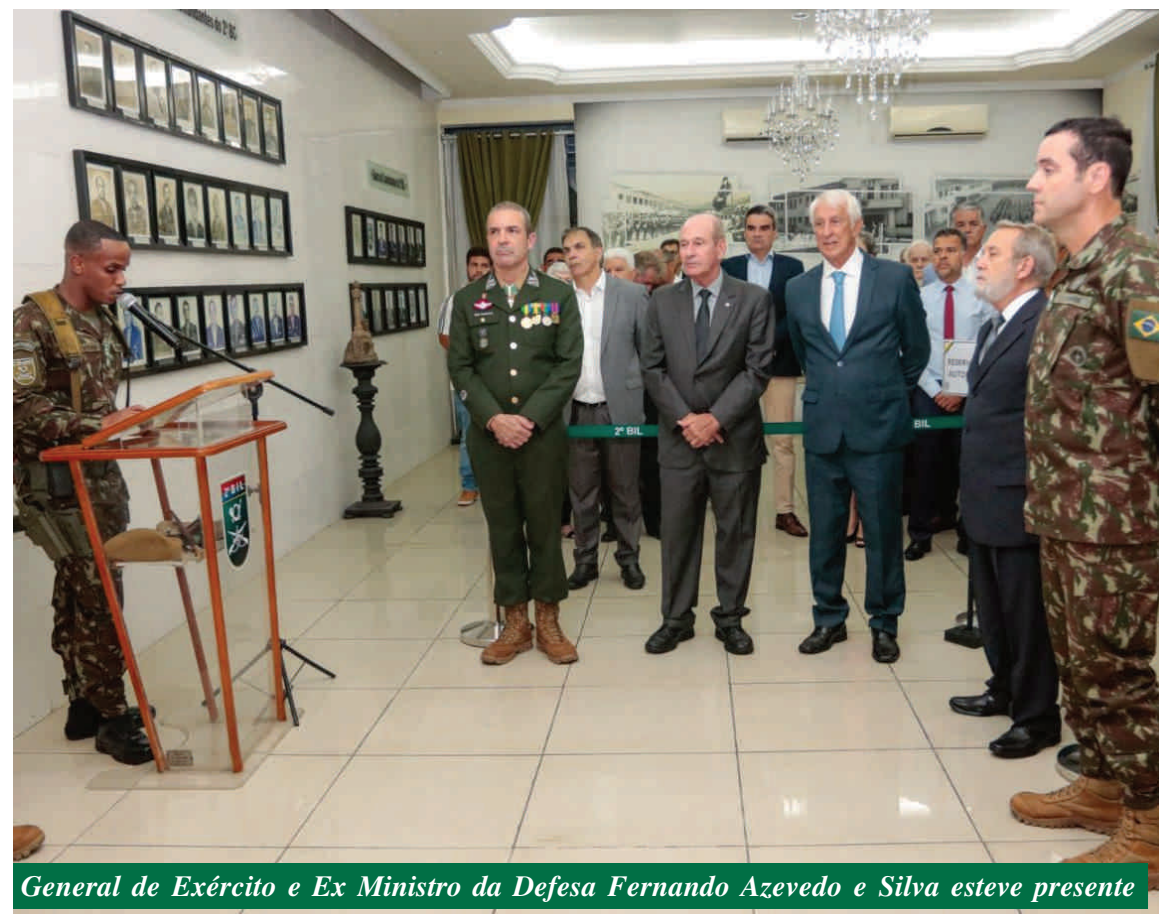
General de Exército e Ex Ministro da Defesa Fernando Azevedo e Silva esteve presente