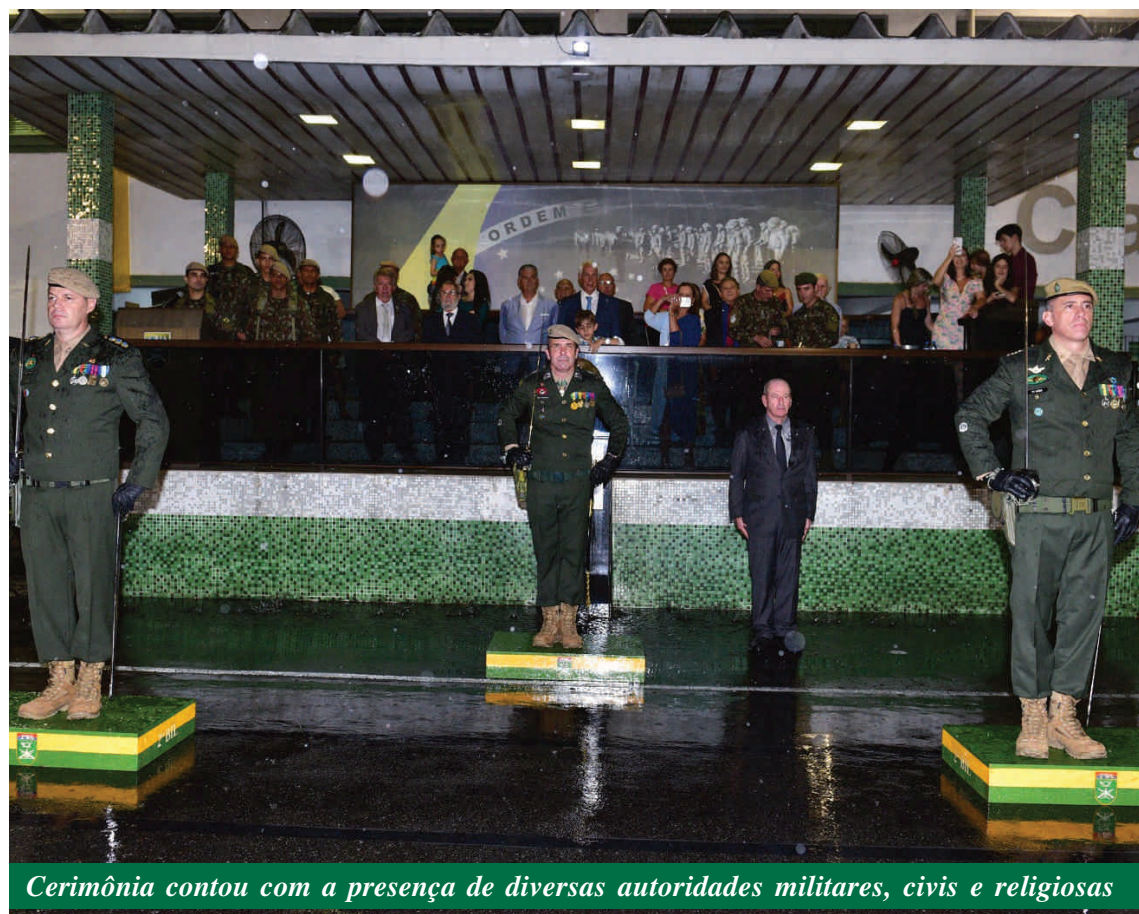
Cerimônia contou com a presença de diversas autoridades militares, civis e religiosas

talhão de Caçadores, 61º Batalhão de Infantaria de Selva, 1º Batalhão de Guardas, 28º Batalhão de Caçadores, 34º Batalhão de Infantaria Mecanizado, Diretoria de Controle de Efetivo e Movimentações, Comando Militar do Nordeste e no Comando da 7ª Divisão de Exército.