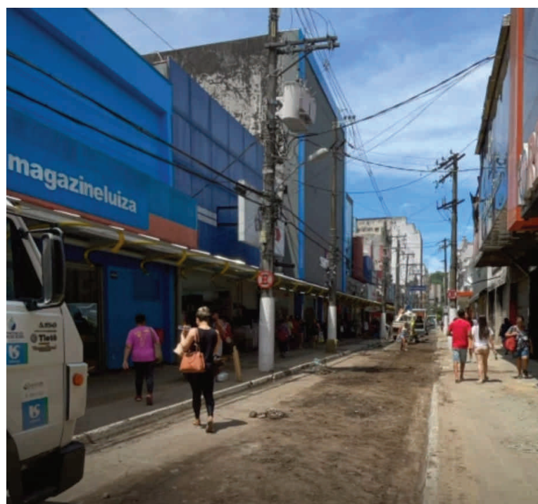
Símbolo do maior comércio popular da Baixada, via passa por obras de revitalização

ções para via compartilhada, serviços de pavimentação, passeios e trecho elevado com o intertravado no primeiro trecho da Rua Martim Afonso. “O planejamento da obra prevê, no trecho entre as ruas João Ramalho e Frei Gaspar, a estruturação da via para tornar-se um boulevard, contando, inclusive, com adaptação para via compartilhada (para