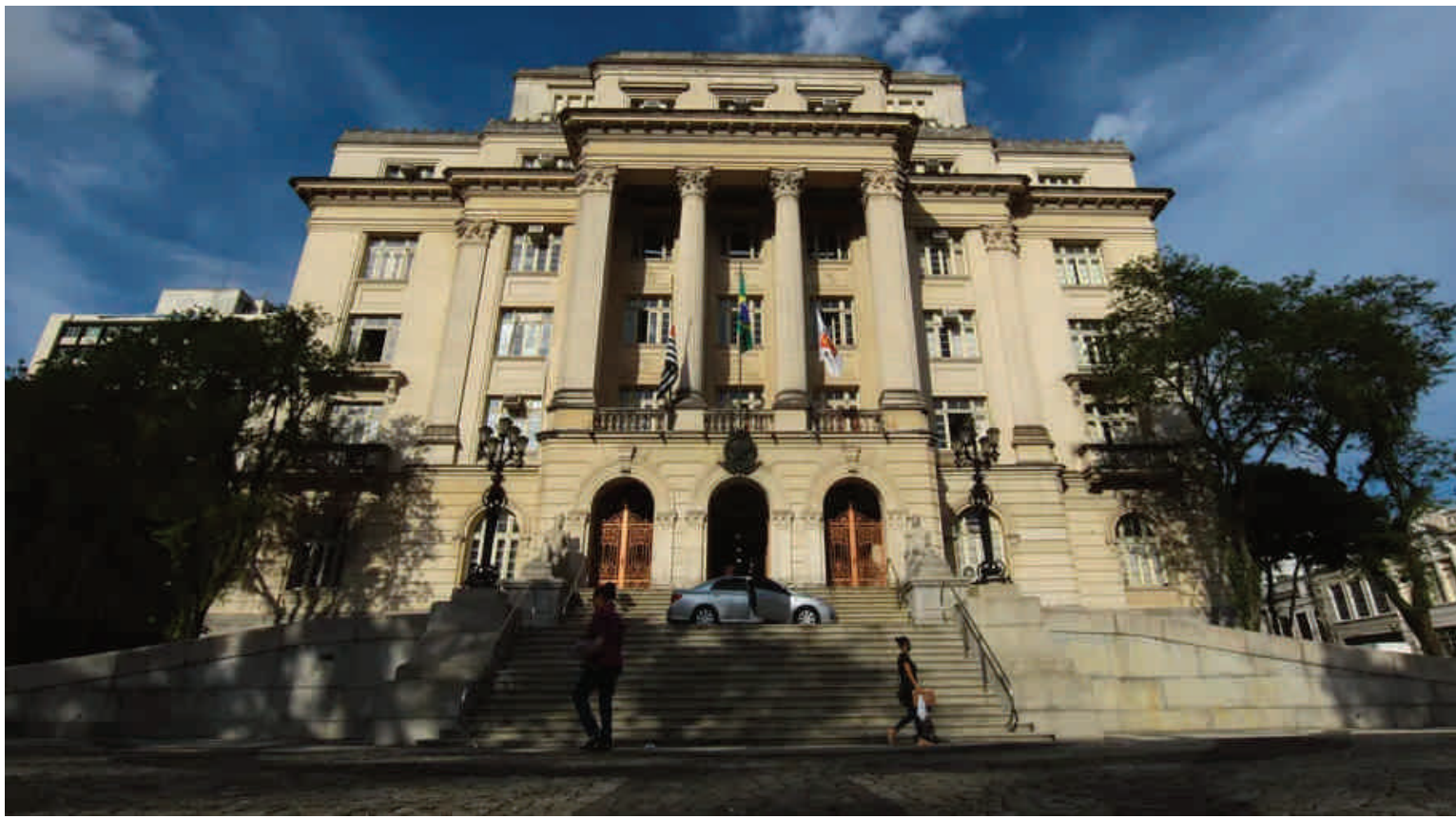
Os salários variam de R$ 2.716,79 (professor adjunto I 105 horas – aulas mensais) a R$ 4.124,89 (intérprete de Libras - 40 horas semanais)

As oportunidades incluem reserva para pessoas com deficiência e para pessoa negra. As vagas estão distribuídas nas seguintes áreas: intérprete de Libras; professor adjunto I (atuação na Educação Infantil e primeiras séries do Ensino Fundamental) e professor adjunto II (Ciências, Matemática, Libras,