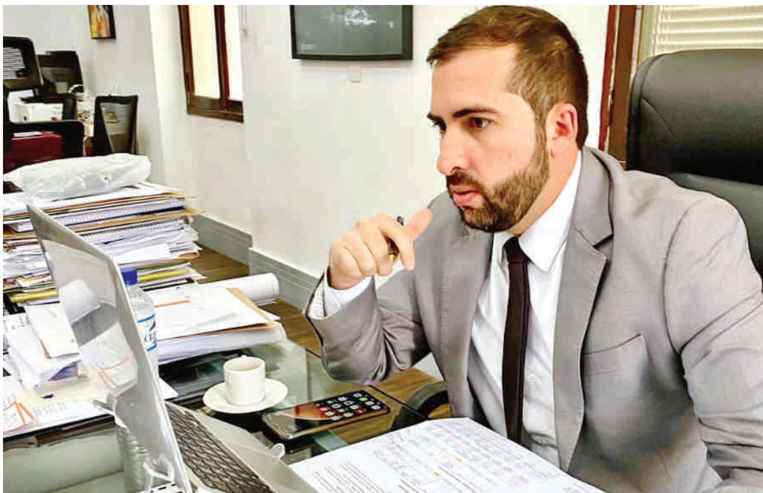
Kayo Amado anunciou oficialmente sua candidatura à presidência do Conselho de Desenvolvimento da Região Metropolitana

Segundo Kayo Amado, uma das estratégias adotadas para o desenvolvimento da Baixada Santista no eventual mandato será o diálogo com os entes federativos. "Hoje tenho uma boa relação com todos os prefeitos e deputados da região, o que entendo que facilitará a condução dos trabalhos. Também construí excelentes diálogos com o Governo do Estado, em especial com o Governador Tarcísio de Freitas".