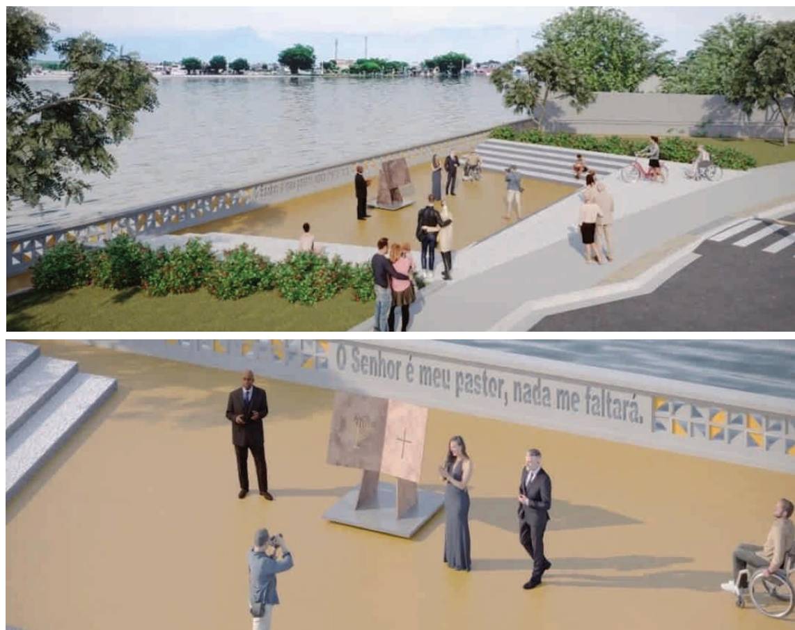
Nova Praça da Bíblia será construída nas proximidades da Ponte Pênsil.

“É a revitalização de espaços públicos para atrair pessoas. Vai muito além de obras 'boni-