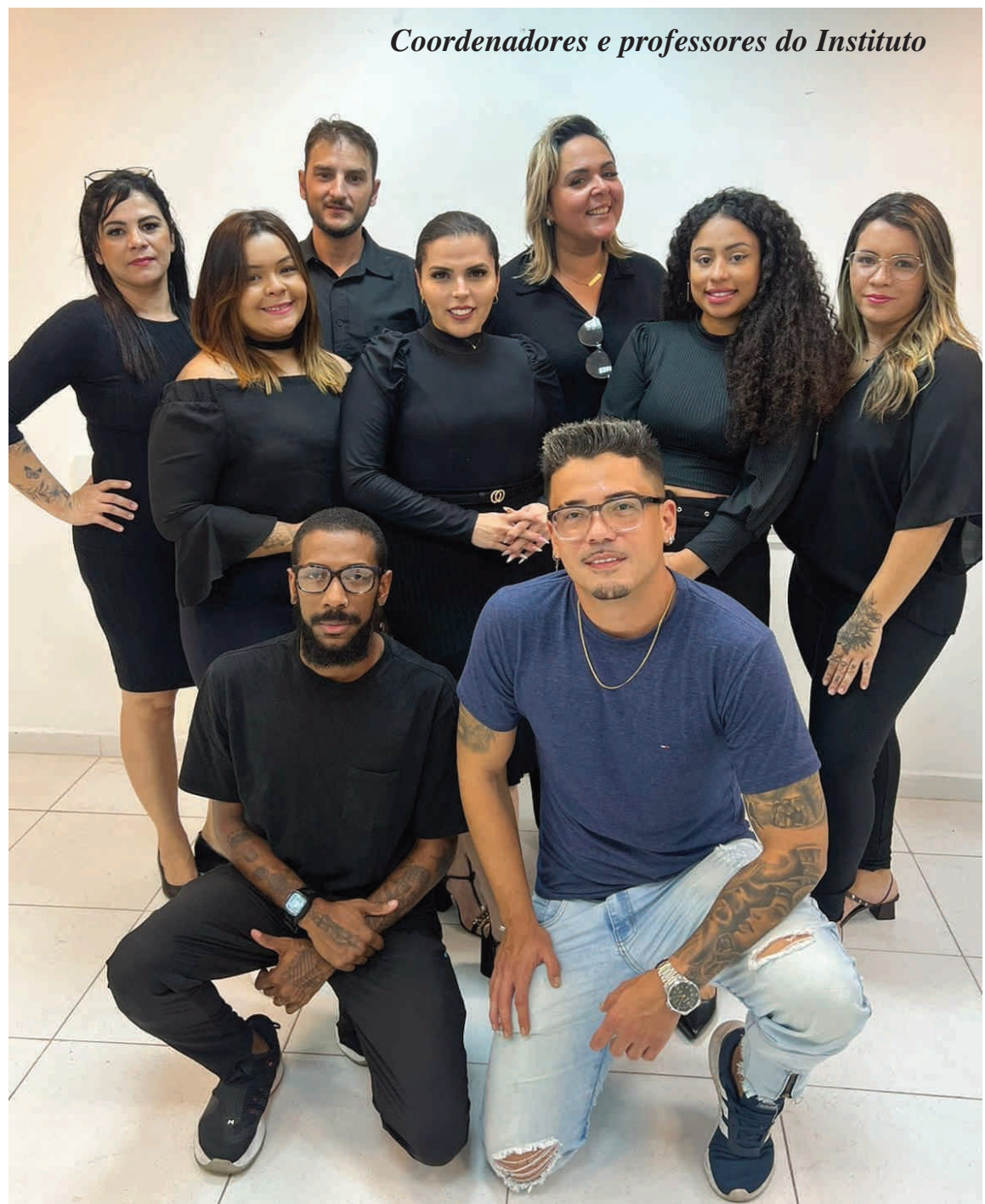
Coordenadores e professores do Instituto

O Instituto Maktub fica no Shopping VipX, na Rua Frei Gaspar, 535,