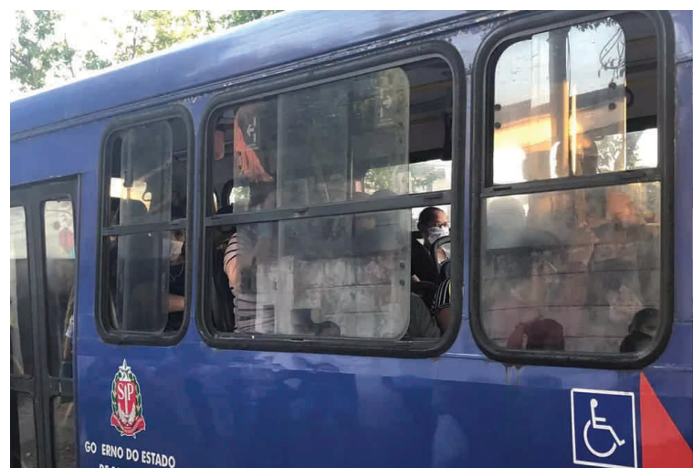
Homem é detido pela Polícia Militar após ser visto portando uma faca dentro de um ônibus intermunicipal, no último domingo em SV.