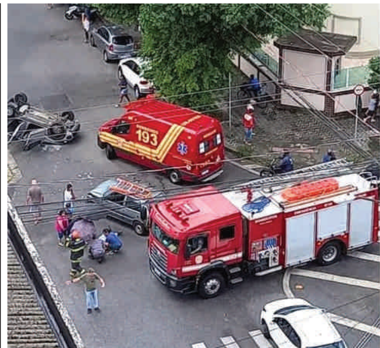
Um carro capotou após uma colisão com outro veículo no cruzamento das ruas Espírito Santos e Amazonas, nesta sexta-feira (12), em Santos.