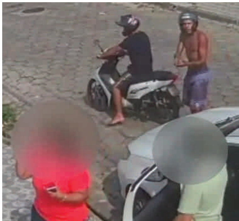
Casal é ameaçado e roubado por dois criminosos armados em São Vicente. Os assaltantes fugiram com os pertences das vítimas.