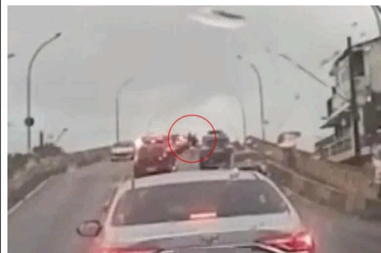
Criminosos são baleados por um PM de folga em assaltado em São Vicente. O agente estava parado no trânsito, quando o celular roubado.