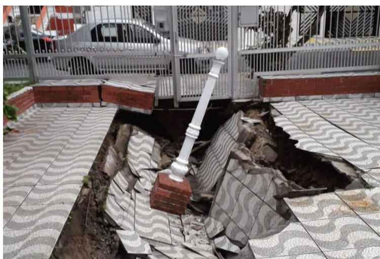
Cratera 'gigante' se abre em área de um prédio e assusta moradores de Praia Grande. O acidente aconteceu na última sexta-feira (12).