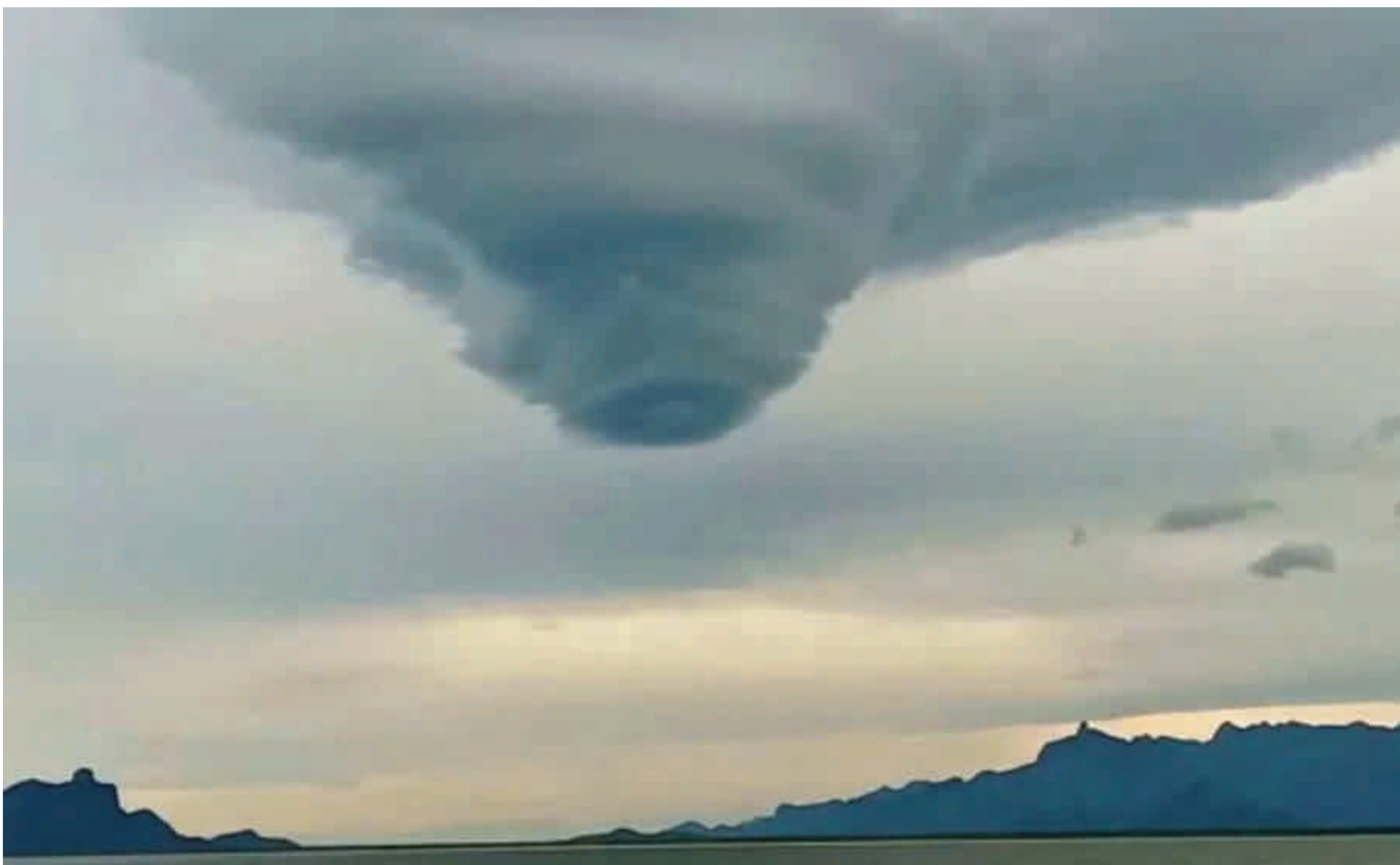
Nuvem Funil: Fenômeno foi registrado por um pescador próximo à Praia do Guaraú, em Peruíbe na última sexta-feira (17).

Defesa Civil emite alerta para forte temporal durante fim de semana