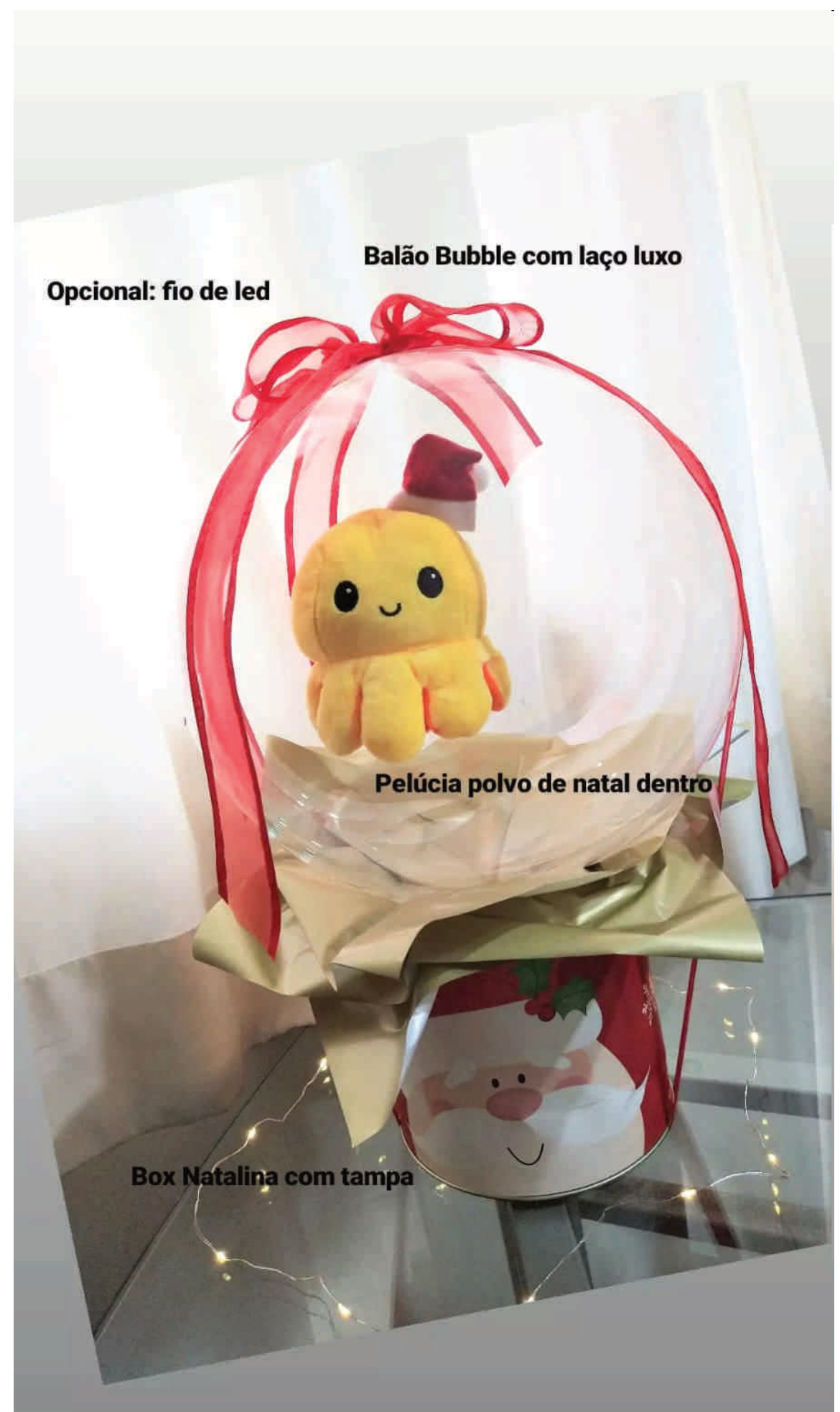
Balão Bubble com laço luxo